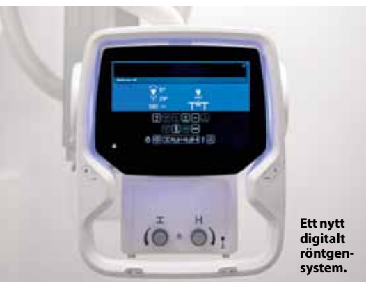
Ett nytt digitalt röntgen-system.

Med över 20 års erfarenhet av displayintegration kan Martinsson Elektronik hjälpa dig att skapa en produkt utöver det vanliga. Vi har en hel utvecklingsavdelning för dig med fokus på displayprojekt. ■