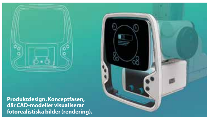
Produktdesign. Konceptfasen, där CAD-modeller visualiserar fotorealistiska bilder (rendering).