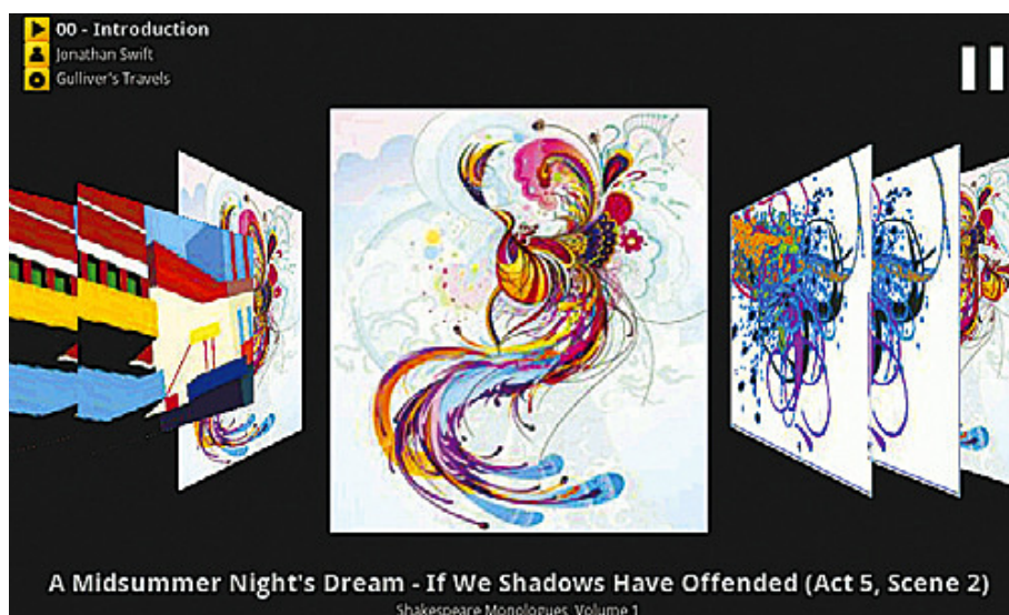
Figur 3: Flexibel specialanpassning av användargränssnitt

tiv för att kundanpassa vanliga märkesspecifika delar såsom skärmbilder för uppstart och avslutning och extra gestbaserade alternativ för telefonens kärnfunktioner såsom samtal och sms.